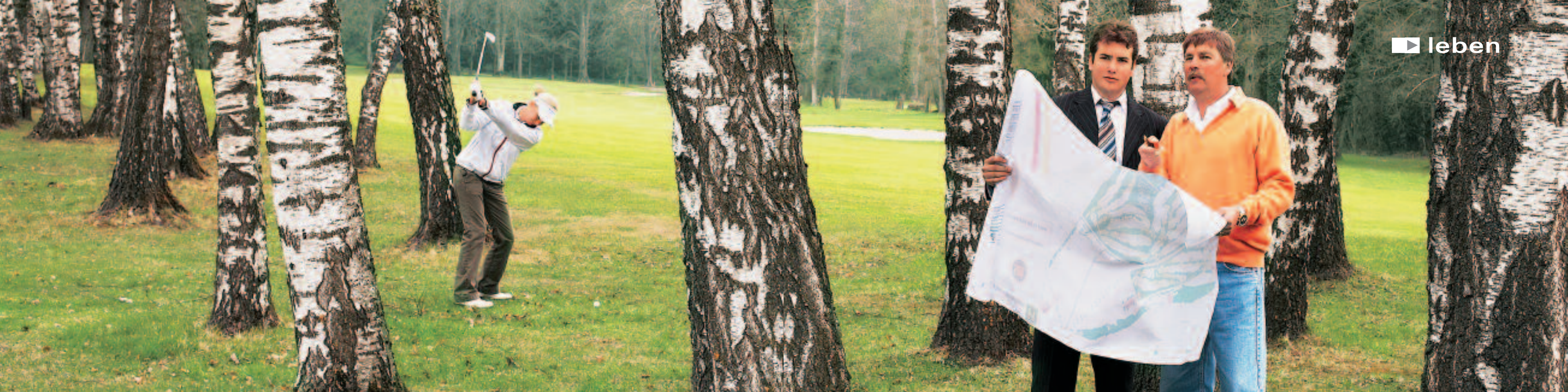
Schwung, Gefühl und Präzision: Nora Angehrn auf dem Weg zum Green. Paulus Grolimund (rechts) und Michael Harradine diskutieren mögliche Veränderungen für die Golfanlage in Bad Ragaz. Die Birken bieten Schutz vor weit geschlagenen Bällen.